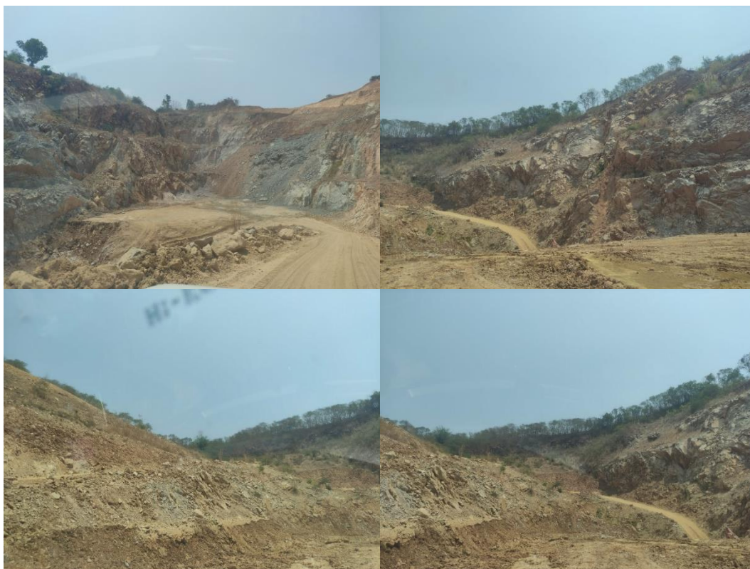
รูปที่ 1-1 สภาพหน้าเหมืองของโครงการในปัจจุบัน (เมษายน 2567)